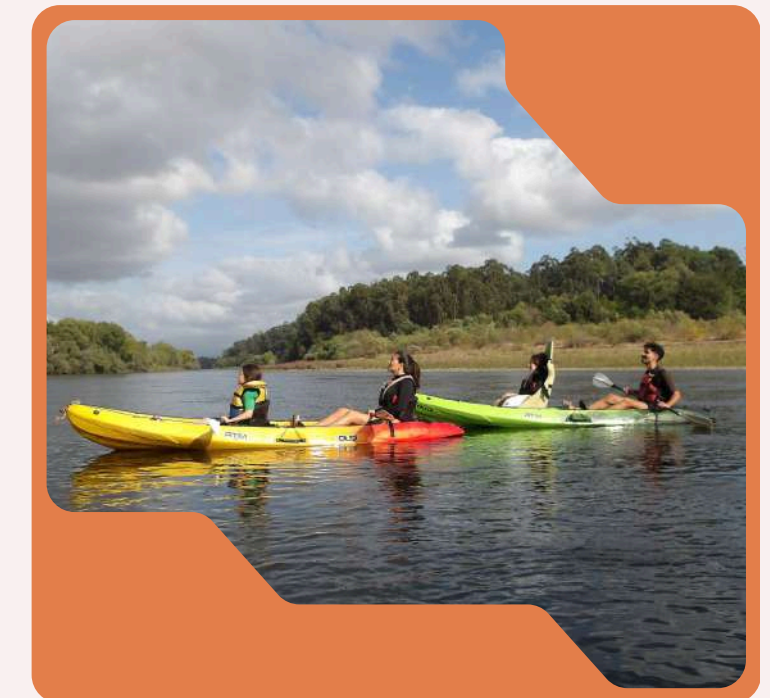
Kayak adaptado en el río