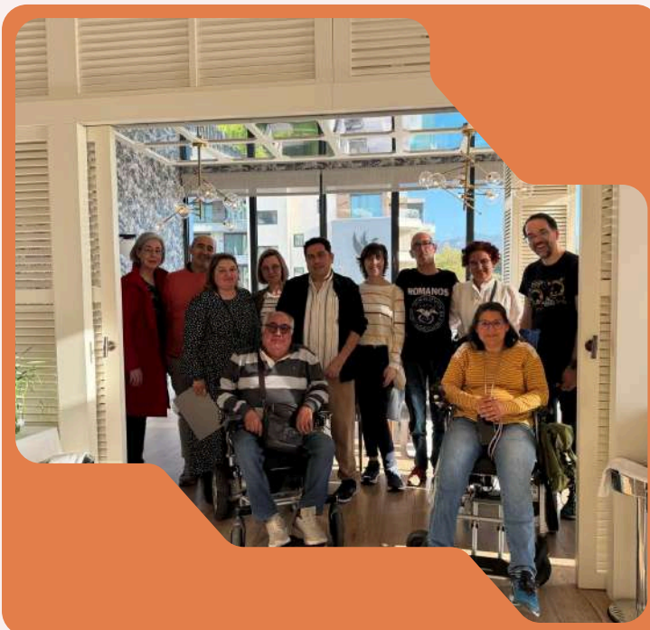
“Café” con especialistas en enfermedades neuromusculares