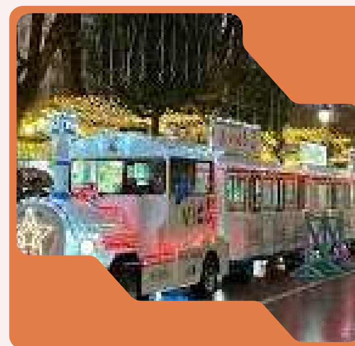
Viaje en el tren navideño