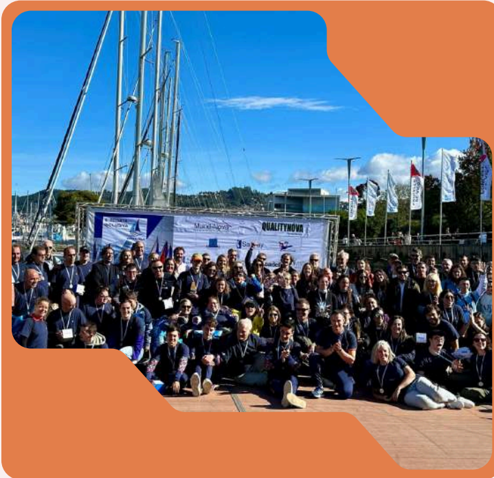
Participación en regata inclusiva