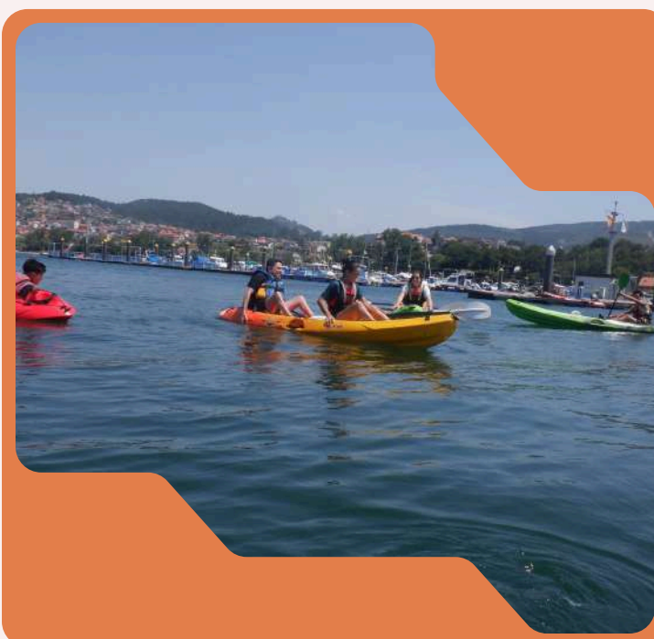
Kayak adaptado en el mar