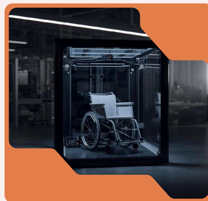
Talleres de productos 3D