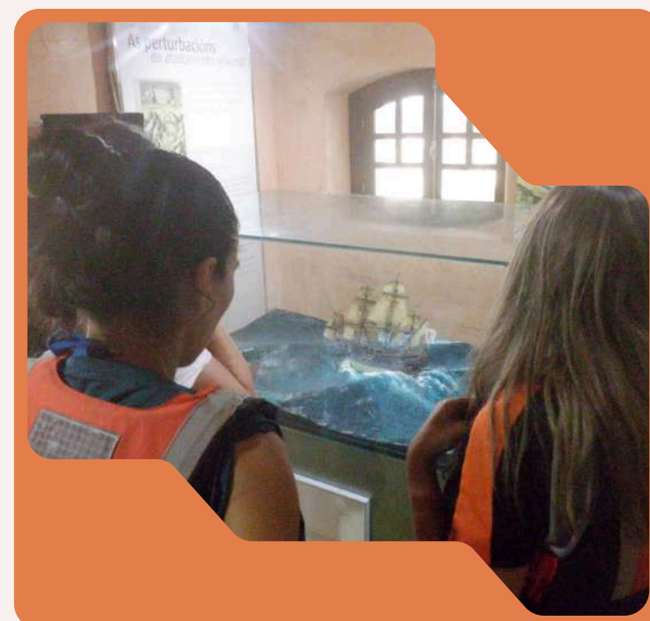
Visita a la Isla San Simón