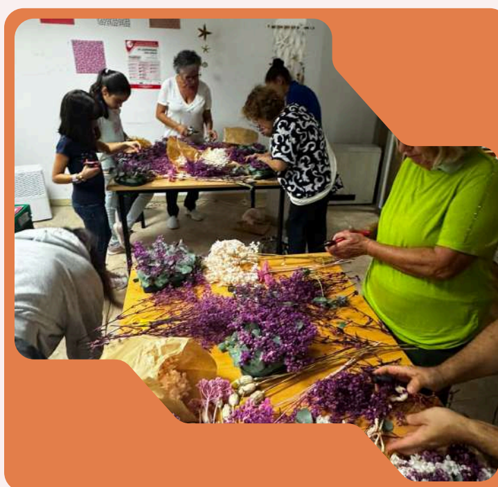
Talleres de arte floral