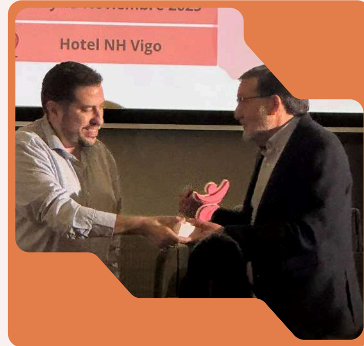
Premios ASEM Galicia